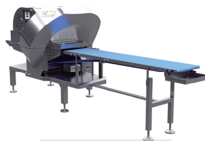
高速高性能スライサー NUS-340Ⅲ『ジュビターⅢ』