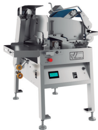
ミートスライサー GNS-350『ベガサス』