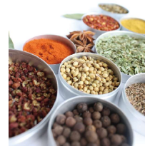
メツゲライマーティン スパイス各種