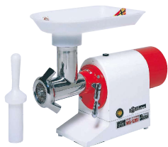
スタンダードミンチ MS-12B