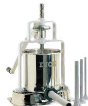
ソーセージスタッパー DICK 6L