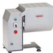
ローダーミキサー RM-20