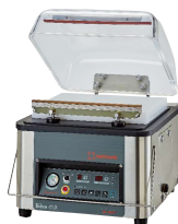
卓上型真空包装機 JW-320TF