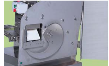
スパイラル刃とフラットな刃物カバー

最高級のステンレス特殊刃物鋼を使用した切れ味抜群のスパイラル刃を装備。超薄切りから厚切りまでムラなく均一にスライス。