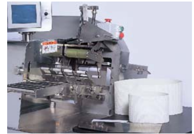
コンベアベルトも工具なしで脱着できます。