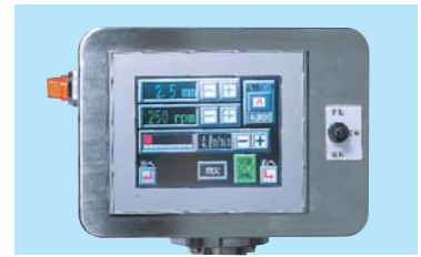
簡単操作の液晶タッチパネル

見やすく、操作しやすいカラータッチパネル画面で、厚み設定・スライス速度から配列の枚数設定まですべてのスライス作業設定が思いのまま。記憶データ・機械の状況チェックも一目で把握できます。異常発性も画面に表示。