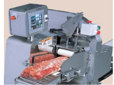
作業のしやすい操作ボタン前面配置