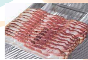
ハム・ベーコン、チーズなどの鱗列が美しく並びます。