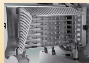
チェーンフレームにカバーが付いており、より安全に作業が出来るようになりました。