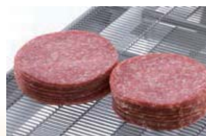
積み重ねもキレイに決まります。