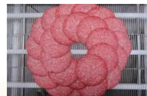
VSI-T・VSI-TWは、こんな円形も自由自在。